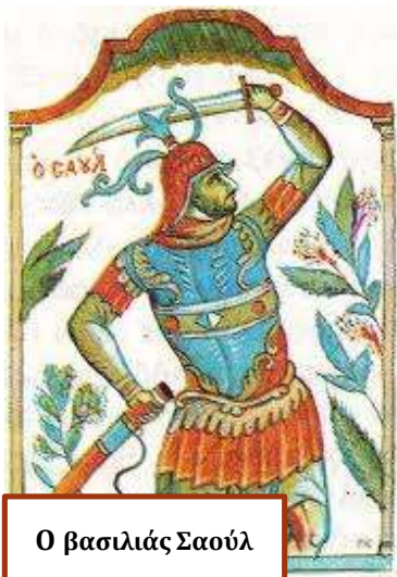
Ο βασιλιάς Σαούλ