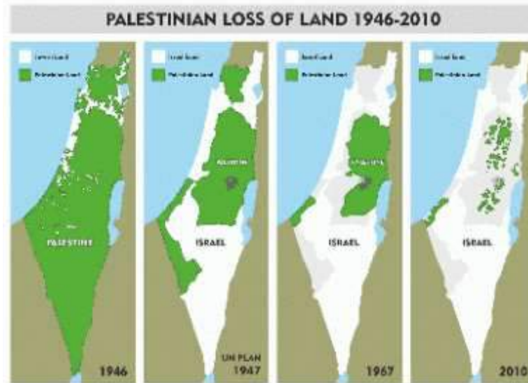
Ο πόλεμος των 6 ημερών